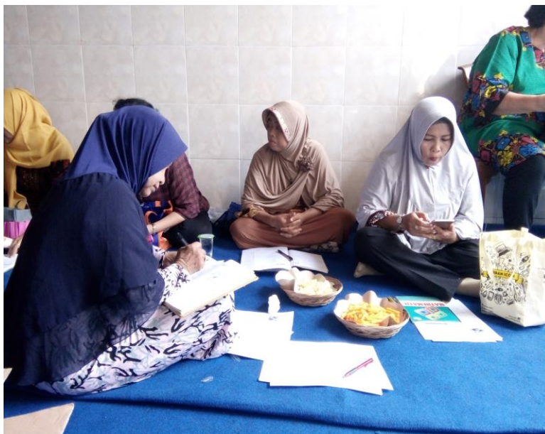
Ibu Ibu PKK Wisma Penjaringansari dalam forum arisan Peserta pelatihan memasak