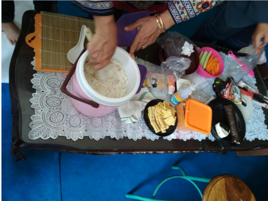
Bahan dan alat yang digunakan

Bahan yang digunakan adalah beras Jepang (jika tidak ada dapat diganti dengan beras lkal ditambah 1 sendok makan beras ketan), sayuran (timun Jepang, wortel), telur, sosis, gula, garam, cuka dan rumput laut ( nori ). Sedangkan alat yang digunakan adalah sushi roll atau cetakan.