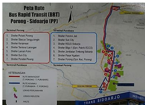
Gambar 1. Rute dan Shelter BRT

BRT Trans Sidoarjo dikelola oleh Perum. DAMRI Cabang Surabaya. Untuk garasi dari BRT Trans Sidoarjo sendiri berada di Perum DAMRI Unit Bis Kota Surabaya yang berada di daerah Jagir Wonokromo. Jam operasional dari BRT Trans Sidoarjo dari pukul 05.00 WIB sampai pukul 19.00 WIB. Sistem pemberangkatan bis dimulai dari garasi pada pukul 05.00 WIB menuju Terminal Porong tanpa membawa penumpang. Ada 6-9 bis langsung menuju Terminal Porong dan hanya 3-4 bis yang menuju Terminal Purabaya. Bis hanya boleh menaikkan dan menurunkan penumpang di shelter-shelter yang tersedia. Pada shelter tertentu akan dilakukan pengecekan/pemeriksaan oleh petugas pengawasan angkutan kota.