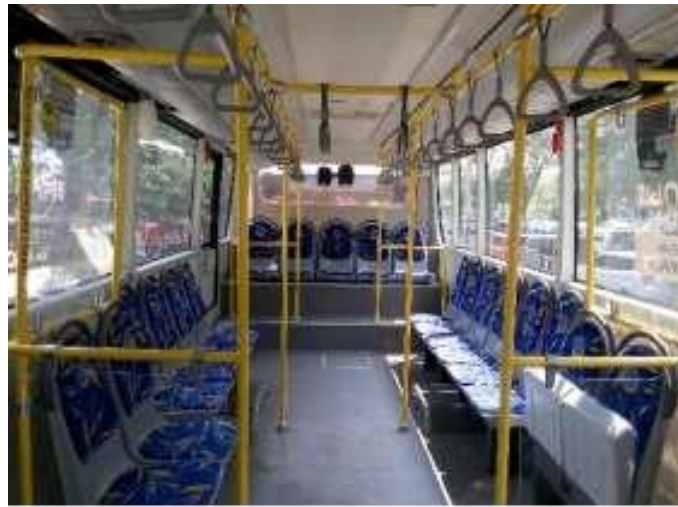
Gambar 2. Kondisi Tempat Duduk dan Berdiri Penumpang

Kondisi tempat duduk dan tempat berdiri penumpang ditunjukkan pada Gambar 2.