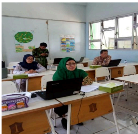
Gambar 1. Peserta saat mengikuti pelatihan Edmodo.

Selama pelatihan, guru didampingi oleh instruktur dalam praktik memanfaatkan fitur-fitur Edmodo. Karena pelatihan berlangsung sejak pukul 09.00–14.00 WIB, peserta mendapatkan snack dan makan siang. Bagi guru yang sudah menyelesaikan tugasnya, diberikan sertifikat sebagai peserta pelatihan. Materi yang disampaikan dalam pelatihan ini meliputi: (1) Pengenalan Edmodo, (2) Perbedaan Edmodo dan Facebook, (3) Fitur-Fitur Edmodo, (4) Manfaat Edmodo untuk Pembelajaran, dan (5) Edmodo Aplikasi Jejaring Sosial untuk Guru dan Murid Belajar Berkolaborasi. Dokumentasi pada bagian ini dapat dilihat pada Gambar 1–Gambar 4.