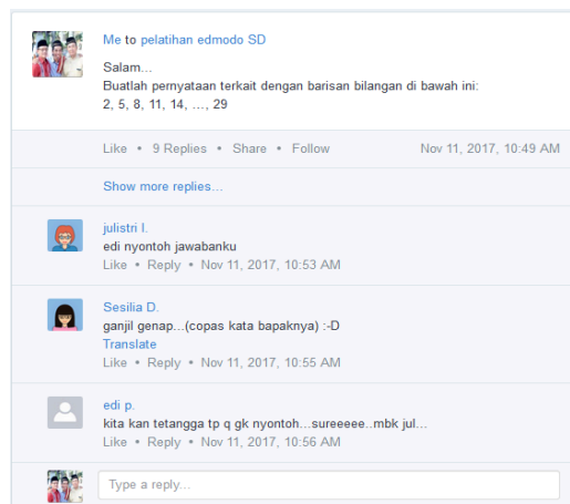
Gambar 4. Pelatihan menjawab soal terbuka berbasis masalah materi matematika untuk mengeksplor kemampuan anak sehingga setiap anak mampu memberikan jawaban yang berbeda-beda.