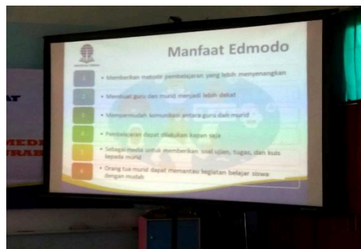
Gambar 2. Tampilan layar mengenai manfaat Edmodo.