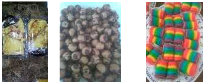
Gambar 2. Hasil Kue Produksi PKK Desa Sawocangkring

Saat ini ibu-ibu PKK di desa Sawocangkring sudah terbentuk mitra bisnis dan aktif menjalankan peluang bisnis baru di bidang produksi kue basah dan kue kering. Namun belum memiliki merk/brand yang layak jual dengan kemasan yang masih sangat rendah kualitasnya, Cara pemasarannya juga sangat tradisional yaitu informasi produknya dibagikan “dari mulut ke mulut” atau word of mouth business communication dan saluran distribusi produk masih dengan cara dititipkan ke warung-warung sekitar desa. Hal ini dapat digambarkan sebagai berikut: