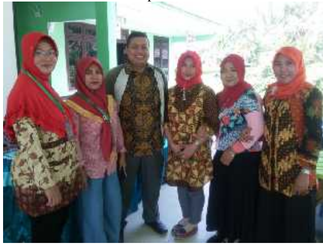
Ibu-Ibu Warga Desa Sawo Cangkring berfoto dengan pembicara dari IMYCO brand