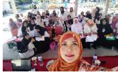
Gambar 1. Pelatihan TKMT Peluang Bisnis Kue Basah dan Kue Kering di Desa Sawocangkring

Desa Sawocangkring terletak di 7,4'LS dan 112,8' BT. Luas wilayah desa Sawocangkring yaitu 206.55 dengan jarak tempuh ke ibukota kecamatan sejauh 6 km. Desa ini merupakan desa di wilayah kecamatan Wonoayu yang paling ujung. Desa ini memiliki Curah Hujan (CH:1543) dan Hari Hujan (HH:125). Luas tanah sawah 134 ha, luas tanah kering 72.55 ha. Desa ini terbagi menjadi tiga dusun yaitu dusun Sawo, dusun Cangkring, dan dusun Lumbang. Batas Desa Sawocangkring, terdiri dari: a) Utara: Desa Cangkringsari, Kecamatan Sukodono, b) Timur: Desa Wilayat, Kecamatan Sukodono, c) Selatan: Desa Ploso dan Wonokasian, Kecamatan Wonoayu, d) Barat: Desa Beciro-ngengor, Kecamatan Wonoayu. Berdasarkan survei yang dilakukan oleh BPS Kabupaten Sidoarjo akhir tahun 2014, desa Sawocangkring memiliki jumlah penduduk kurang lebih 2623, terdiri dari 1142 Kepala Keluarga (KK). Jumlah penduduk tersebut terdiri dari 41% laki-laki dan 59% perempuan. Penduduk perempuan di Desa Sawocangkring sekitar 1.522, jumlah perempuan usia produktif sekitar 771 atau 53 persen. Jumlah tersebut dapat dinilai mampu berperan untuk membantu laki-laki meningkatkan kesejahteraan dalam keluarga (BPS Sidoarjo, 2015).