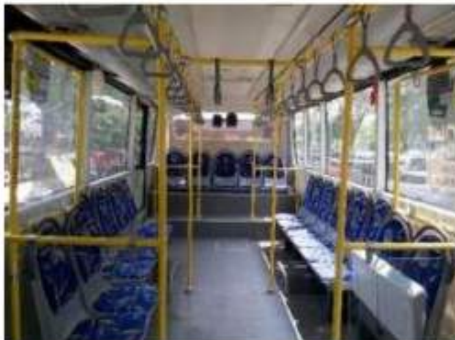
Gambar 2. Kondisi Tempat Duduk dan Berdiri Penumpang

Dari hasil perhitungan diatas bisa dilihat bahwa kapasitas total dari BRT ( C_v ) adalah 80 penumpang per armada sehingga untuk satu jam dengan jumlah armada 4 bis didapat dari hasil analisis maka kapasitas totalnya 320 penumpang setiap armada. Kondisi tempat duduk dan tempat berdiri penumpang ditunjukkan pada Gambar 2.