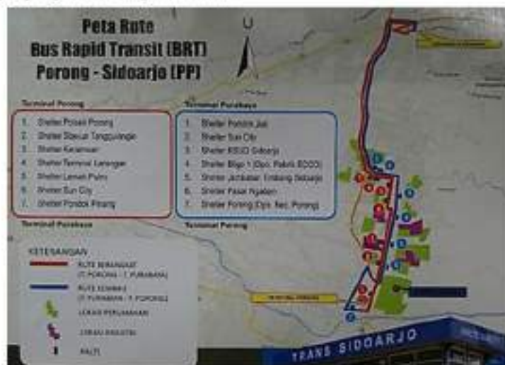
Gambar 1. Rute dan Shelter BRT

BRT Trans Sidoarjo dikelola oleh Perum. DAMRI Cabang Surabaya. Untuk garasi dari BRT Trans Sidoarjo sendiri berada di Perum DAMRI Unit Bus Kota Surabaya yang berada di daerah Jagir Wonokromo. Jam operasional dari BRT Trans Sidoarjo dari pukul 05.00 WIB sampai pukul 19.00 WIB. Sistem pemberangkatan bus dimulai dari garasi pada pukul 05.00 WIB menuju Terminal Porong tanpa membawa penumpang. Ada 6 bus langsung menuju Terminal Porong dan hanya 4 bus yang menuju Terminal Purabaya. Bus hanya boleh menaikkan dan menurunkan penumpang di shelter-shelter yang tersedia. Pada shelter tertentu akan dilakukan pengecekan/pemeriksaan oleh petugas pengawasan angkutan kota.