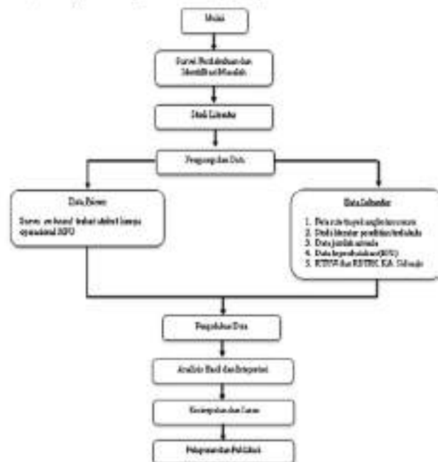
Gambar 1. Diagram alir penelitian

Penelitian ini menggunakan metode deskriptif kuantitatif dengan parameter yang mengacu pada atribut-atribut yang digunakan dalam pengumpulan data. Penelitian kuantitatif berusaha mencari penjelasan hubungan antara variabel-variabel yang diteliti dengan menggunakan data berupa angka-angka (Sugiyono, 2008). Adapun alur penelitian seperti pada Gambar 1.