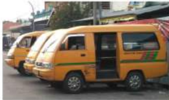
Gambar 2. Kondisi Angkutan Umum Lyn HB 1

Trayek Lyn HBI jurusan Tulangan-Terminal Larangan merupakan salah satu trayek angkutan umum yang memberi kontribusi cukup tinggi terhadap pergerakan manusia di Koridor Barat menuju Pusat Kabupaten Sidoarjo. Trayek ini dilayani angkutan umum (MPU) berkapasitas 12 penumpang/armada dengan rute berangkat melewati Sub Terminal Tulangan – Jl. Raya Tulangan – Jl. Raya Kemantren – Jl. Raya Modong – Jl. Raya Banar – Jl. Raya Pilang – Jl. Raya Lebo – Jl. Raya Suko – Jl. Raya Cemengkalang – Jl. Raya Jati – Jl. Pahlawan – Jl. Gajah Mada – Jl. Raden Patah – Jl. Majapahit – Terminal Larangan. Rute kembali melewati Terminal Larangan – Jl. Diponegoro – Jl. Pahlawan – Jl. Raya Jati – Jl. Raya Cemengkalang – Jl. Raya Suko – Jl. Raya Lebo – Jl. Raya Pilang – Jl. Raya Banar – Jl. Raya Modong – Jl. Raya Kemantren – Jl. Raya Tulangan – Sub Terminal Tulangan. Tata guna lahan yang dilewati rute angkutan umum (MPU) trayek Lyn HBI meliputi kawasan pemukiman, perkantoran, pertokoan, pendidikan dan industri sehingga potensi tarikan-bangkitan perjalanan cukup tinggi. Adapun kondisi dan dimensi armada ditunjukkan pada gambar 2 dan gambar 3.