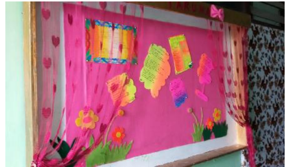
Hasil Buku Ontologi Puisi