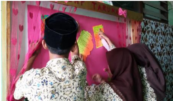
Siswa menempelkan kreasi madding