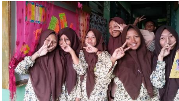
Keceriahan siswa sesudah melaksanakan kegiatan Buku Ontologi Puisi