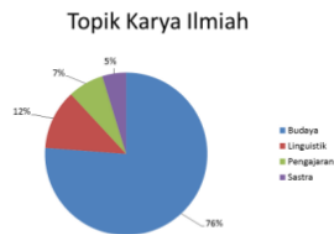
Grafik 1. Persentase Jenis Topik pada Hasil Karya Ilmiah Mahasiswa Ryuugaku

Dari hasil tersebut dapat dikatakan bahwa meski mahasiswa bermaksud memperdalam kemampuan bahasa, ketertarikannya cenderung pada aspek budaya.