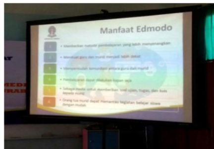
Gambar 2. Tampilan layar mengenai manfaat Edmodo.