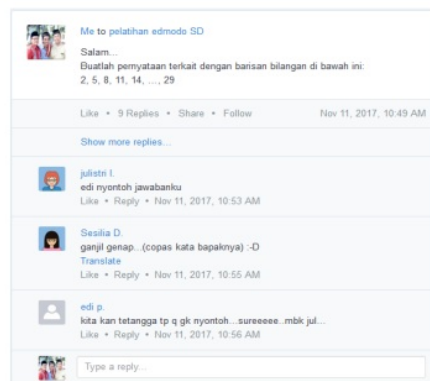
Gambar 4. Pelatihan menjawab soal terbuka berbasis masalah materi matematika untuk mengeksplor kemampuan anak sehingga setiap anak mampu memberikan jawaban yang berbeda-beda.