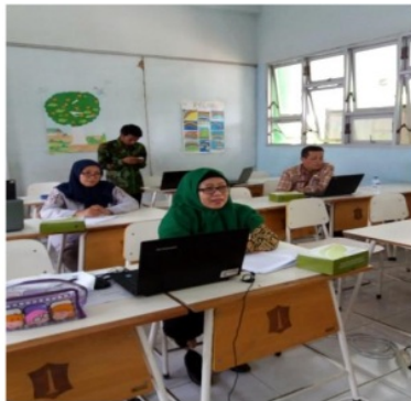
Gambar 1. Peserta saat mengikuti pelatihan Edmodo.

Selama pelatihan, guru didampingi oleh instruktur dalam praktik memanfaatkan fitur-fitur Edmodo. Karena pelatihan berlangsung sejak pukul 09.00–14.00 WIB, peserta mendapatkan snack dan makan siang. Bagi guru yang sudah menyelesaikan tugasnya, diberikan sertifikat sebagai peserta pelatihan. Materi yang disampaikan dalam pelatihan ini meliputi: (1) Pengenalan Edmodo, (2) Perbedaan Edmodo dan Facebook, (3) Fitur-Fitur Edmodo, (4) Manfaat Edmodo untuk Pembelajaran, dan (5) Edmodo Aplikasi Jejaring Sosial untuk Guru dan Murid Belajar Berkolaborasi. Dokumentasi pada bagian ini dapat dilihat pada Gambar 1–Gambar 4.