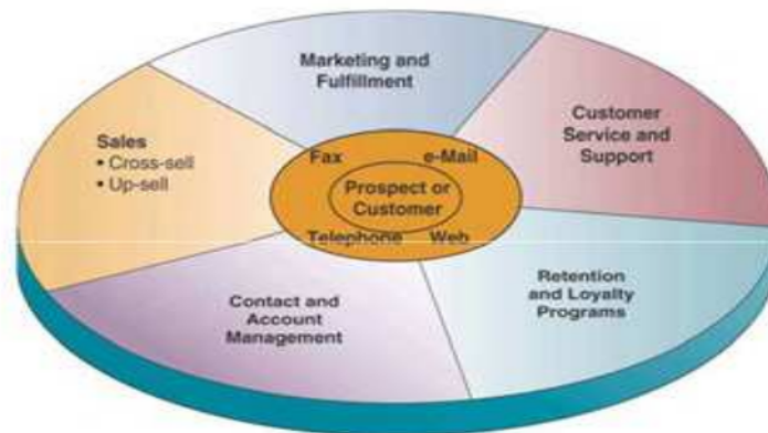
Gambar 2: Sistem CRM pada Proses Bisnis

perusahaan. Selain itu sistem CRM juga meliputi sekumpulan modul software yang membantu aktivitas bisnis perusahaan, seperti proses kantor depan. Software CRM adalah sebuah alat yang memungkinkan perusahaan untuk memberikan layanan yang cepat, prima serta konsisten pada pelanggannya dan dapat digambarkan sebagai berikut: Pada Gambar 2 menggambarkan seberapa penting aplikasi CRM bagi perusahaan-perusahaan. Banyak paket software diciptakan untuk memudahkan customer relationship , tetapi kebanyakan tergantung dari perolehan, updating dan utilisasi profil individu pelanggan. Profil-pelanggan ini biasanya disimpan dalam data warehouse, dan data mining digunakan untuk mengekstrasi informasi yang berhubungan dengan perusahaan dari pelanggan yang bersangkutan. Selanjutnya profil pelanggan ini terhubung secara on line sehingga mereka yang bekerja dalam perusahaan itu dapat menghubungi pelanggan yang bersangkutan. Selain itu Web-based front-ends telah diciptakan sehingga pelanggan dapat menghubungi perusahaan secara online untuk memperoleh informasi mengenai produk atau jasa yang ditawarkan oleh perusahaan itu, memesan order, mengecek status order yang ada, memperoleh jawaban atas pertanyaan yang diajukan atau untuk memperoleh layanan. Paket software CRM membantu perusahaan untuk memasarkan, menjual, dan melayani pelanggan melalui multi media, termasuk Web, call centers, field representatives, business partners, retail dan dealer networks .