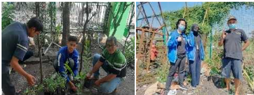
Gambar : 3.4 Partisipasi Warga Dalam Penanaman Pohon