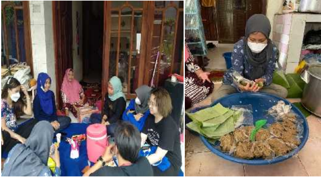
Gambar : 3.9 Pembuatan Otak-Otak Bandeng