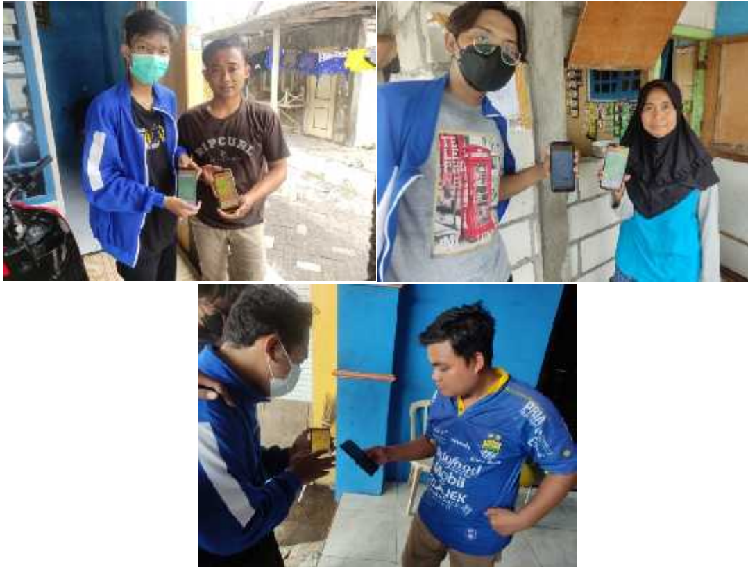
Gambar : 3.5 Sosialisasi InaRisk