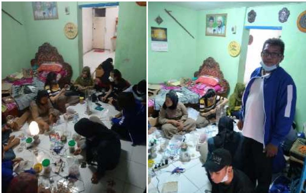
Gambar : 3.7 Pembuatan Kerajinan

Kekurangan bidang pemasarannya yang masih kurang atau belum meluas, dan tidak adanya lahan toko untuk kerajinan oleh-oleh ini. Sehingga hanya bisa membeli melalui internet, nomor telepon, pesan, atau mulut ke mulut. Barangnya juga tidak selalu sama, sistemnya unlimited yang modelnya selalu ganti-ganti. Harga satuan produk mulai dari Rp 7.000 – Rp 150.000, sehingga perlu bimbingan dan pembinaan dalam memasarkan produk.