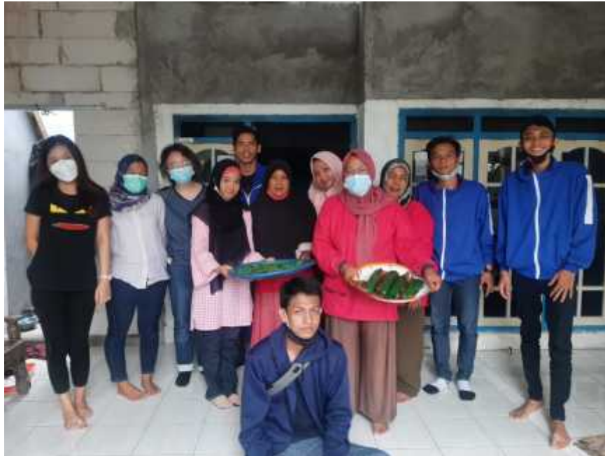
Gambar : 3.8 Pembuatan Krupuk Sisik Bandeng