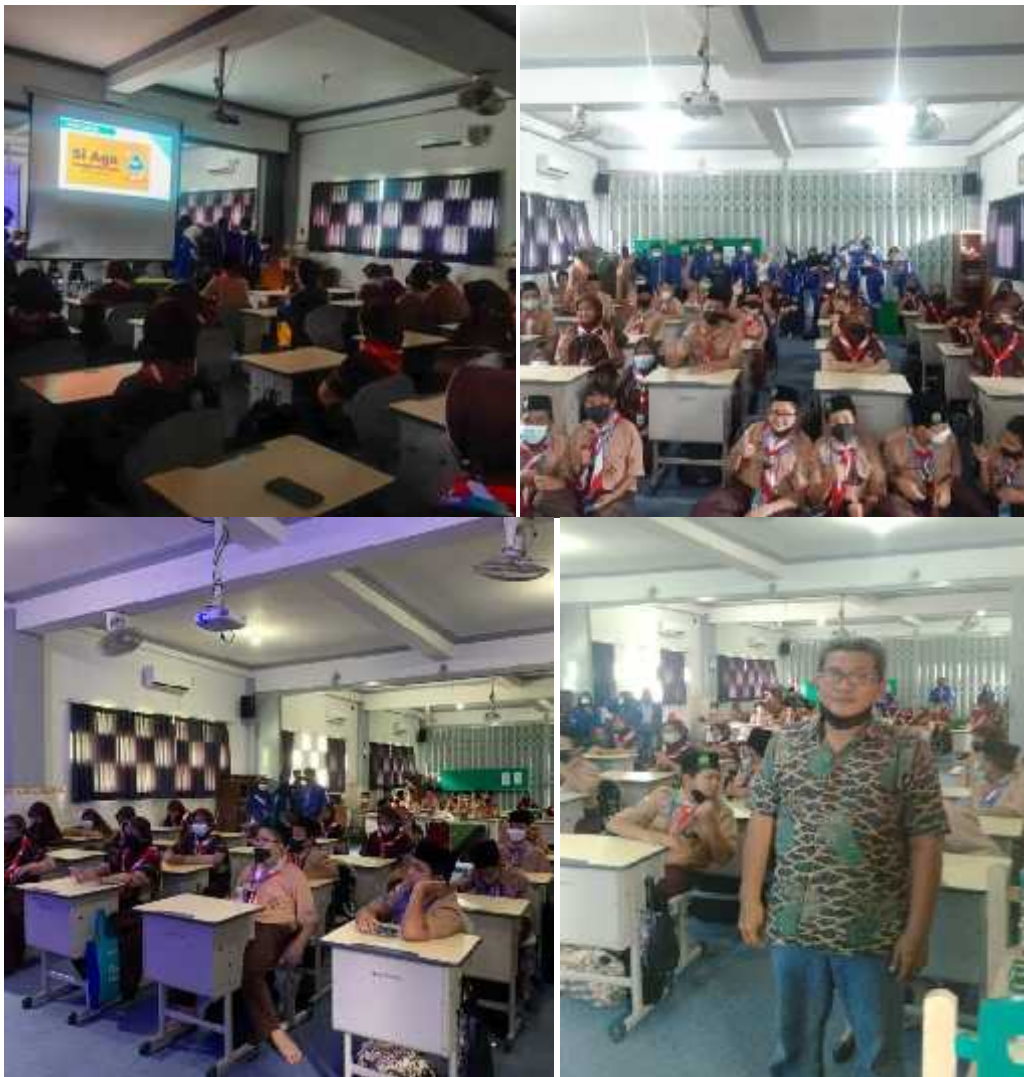
Gambar : 3.6 Edukasi Mitigasi Bencana Pada Anak Sekolah