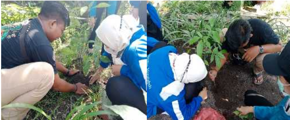
Gambar : 3.3 Penghijauan Dengan Penanaman Pohon