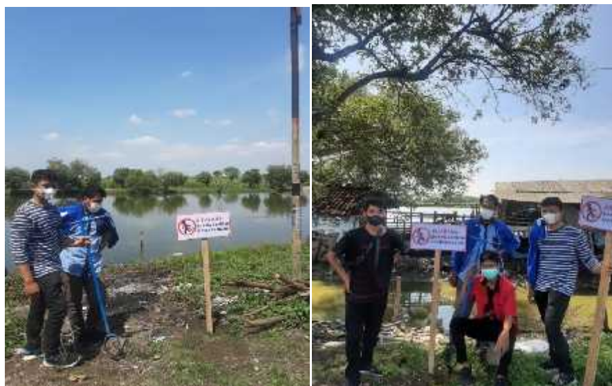
Gambar : 3.1 Pemasangan Plakat Jalur Evakuasi

Pemasangan papan dilakukan pada tiga titik tempat berdasarkan area yg sekiranya dapat menghambat laju arus air dan diarea dekat tambak. Pemasangan papan jalur evakuasi pada empat titik tempat dengan mempertimbangkan lokasi yang mudah terkena dampak banjir. Pemasangan papan titik kumpul ditetapkan berdasarkan luas tempat dan lokasi yang tidak terkena banjir.