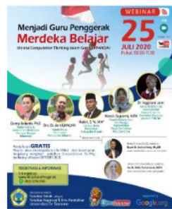
Gambar 1. Flyer Kegiatan Webinar I

Webinar di tahap satu dilaksanakan dengan tujuan meningkatkan pengetahuan Guru tentang informatika dan berpikir komputasi. Selain itu, tujuan utamanya adalah untuk menjangkau Guru sasaran atau guru penggerak yang akan dilatih tentang berpikir komputasi dan tantangan bebras. Untuk itu, dihadirkan nara sumber dari Dinas Pendidikan Kota Surabaya, Sidoarjo dan Gresik. Harapannya didapatkan guru sasaran di tiga kota tersebut mengingat Biro Universitas Dr. Soetomo berkedudukan di Surabaya. Pada kesempatan tersebut juga dilakukan kerjasama dengan tiga Kepala Dinas Pendidikan Kota tersebut. Sehingga kegiatan webinar dapat dipromosikan ke komunitas Guru dan Kelompok Profesi yang menangani Guru melalui media sosial (MEDSOS) ketiga Dinas Pendidikan Kota. Penggunaan MEDSOS, didasarkan atas pendapat Asse (Azlam & Asse, 2018) yang mengatakan bahwa pada 2016 pengguna internet Indonesia merupakan terbanyak ke 12 dunia dengan jumlah 53.236.719 atau 20,4% dari total populasi masyarakat keseluruhan. Demikian juga ditemukan bahwa semua guru mempunyai gadget dan bisa mengoperasikan whatsapp messenger (Hatip dkk., 2021). Flyer yang disebar ke MEDSOS komunitas guru disajikan pada gambar 1 berikut ini.