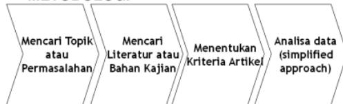
Gambar 1 Gambar Tahapan Literature Review

Melalui penelitian menyeluruh dan interpretasi temuan dari literatur pada subjek tertentu, proses kajian literatur bertujuan untuk memberikan kerangka terkait temuan baru dan temuan sebelumnya untuk menentukan ada atau tidaknya kemajuan dari hasil penelitian. Yang di dalamnya mengembangkan pertanyaan-pertanyaan penelitian dengan melakukan penelusuran buku secara sistematis dan analisis terhadap sumber-sumber yang ada. (Randolph, 2009).