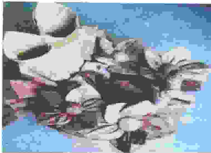
Terbuat dari Sprei, Bantal dan Guling