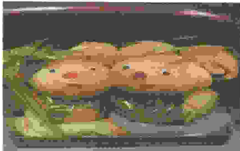
Terbuat dari Handuk