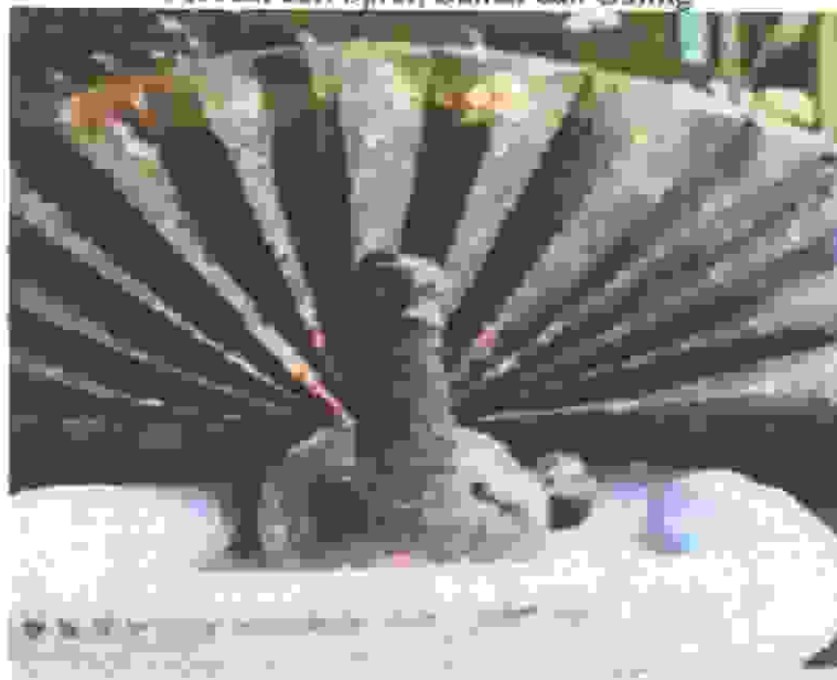
Terbuat dari Kain .