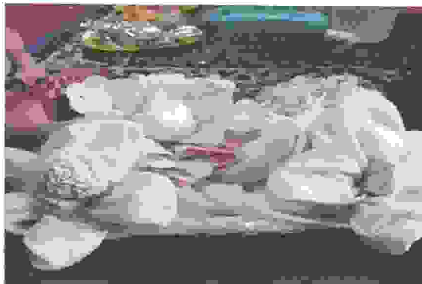
Terbuat dari mukena dan sajadah