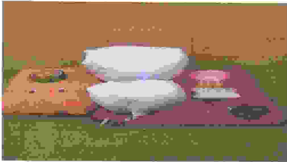
1.3. Dokumentasi Sarung Bantal sebagai bahan baku Angsa dan Bahan- Bahan Penolong lainnya.