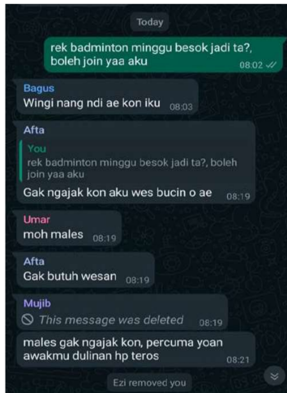
Gambar 9 cyber bullying yang dialami vadio samsuddin

“Mungkin bullying yang saya dapatkan itu seperti dikucilkan dalam sebuah obrolan, tidak jarang juga saya mendapatkan hinaan secara fisik. Mungkin niatnya mereka hanya bercanda saja buat seru – seruan tapi tetap saja hal itu terkadang membuat saya merasa sedikit down ” ( hasil wawancara dengan Vadio )