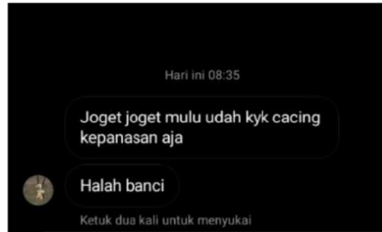
Gambar 7 Cyberbullying yang dialami Reynaldi

mengunggah hal yang bisa menyorot kreativitas yang aku miliki” (hasil wawancara dengan Reynaldi)