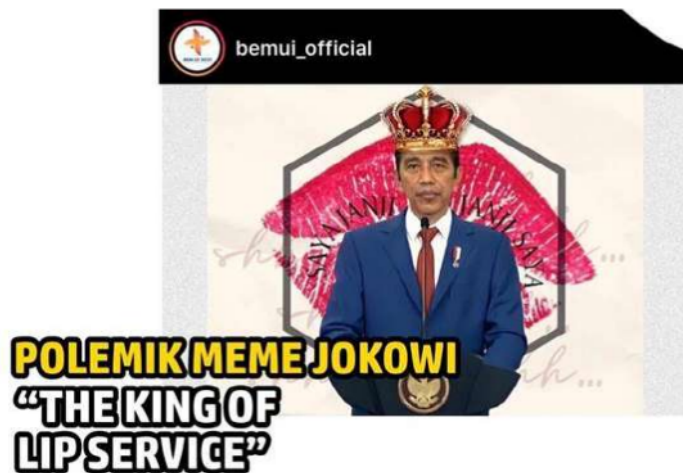
Gambar 1 Meme jokowi pada instagram bem Universitas Indonesia

Bukti nyata dari hal ini ialah seperti banyak beredarnya meme tentang presiden RI di internet. Meme sendiri merupakan sebuah gambar yang disertai dengan naras - narasi lucu, di mana hal ini dilakukan dengan berbagai macam motif seperti untuk ajang candaan, sarkasme atau pun digunakan sebagai alat penyampaian kritik terhadap pemerintah. Salah satu kasus yang terjadi ialah seperti sebuah kasus yang melibatkan universitas Indonesia di mana sebuah lembaga organisasi mahasiswa yang mencoba menyuarakan kritik mereka terhadap pemerintahan yang dituangkan melalui sebuah meme yang diunggah pada salah satu akun media sosial resmi sebuah lembaga organisasi yang dinilai sebagai tindakan yang melanggar kode etik.