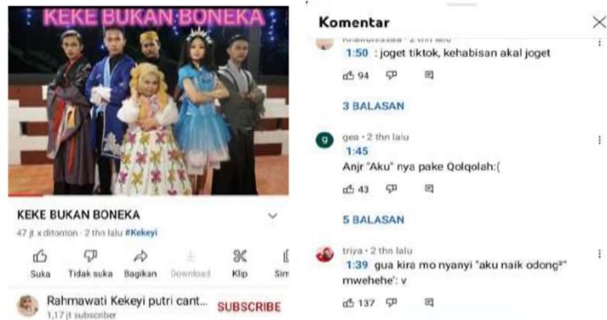
Gambar 2 hujatan pada kanal youtube kekeyi

Berdasarkan pada gambar 1 bahwa kasus cyber bullying yang lainnya juga bisa menimpah seorang public figur seperti salah satu influencer bernama kekeyi yang merupakan seorang beauty vlogger yang kerap mendapat banyak hinaan melalui akun media sosialnya. Salah satunya ialah pada kanal youtube miliknya yang berisi rilisan musik video dari lagu berjudul “Keke Bukan Boneka”.