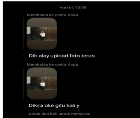
Gambar 6 cyber bullying yang dialami dewi

“Jadi waktu itu aku upload foto aku di instagram, nah ada orang asing yang balas bilang alay gitu. Itu aja kita saling tidak kenal, dia sama orang asing saja seperti itu tingkahnya, bagaimana kalau kenal lagi pasti bakal lebih parah sih....” . (hasil wawancara dengan Dewi)