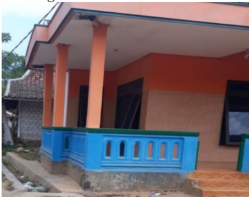
Gambar 2. Rumah Bapak Fauzi sebelum digunakan untuk perpustakaan Mini Desa Madulang

Para pelaku pembentukan tersebut bermusyawarah untuk merumuskan kata sepakat berdasarkan aspirasi, keinginan dan kepentingan masyarakat untuk membangun perpustakaan mini di Desa Madulang dimana tempatnya yang paling tepat yaitu di rumah Bapak Fauzi (salah satu perangkat desa Madulang) dan membantu menambah buku-buku pembelajaran untuk PAUD yang berada di rumah Klebun Desa Madulang.