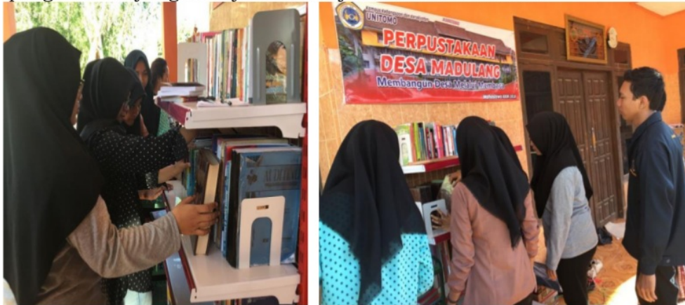
Gambar 4. Penataan Letak Literatur/Buku-Buku, Majalah dan Koran