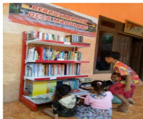
Gambar 3. Rumah Bapak Fauzi setelah digunakan untuk Perpustakaan Mini