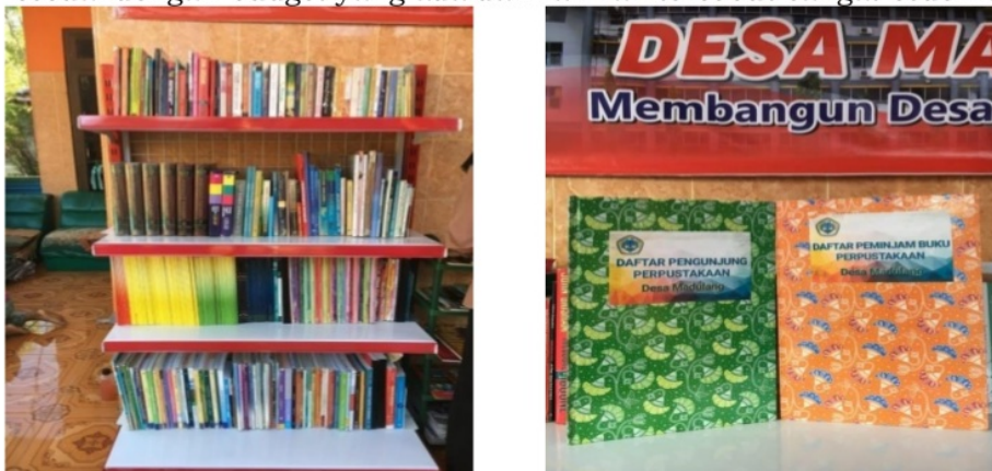
Gambar 5. Penyiapan Rak Perpustakaan dan Buku Daftar Pengunjung serta Daftar Peminjam Buku

Perpustakaan Mini di desa Madulang, dengan berbagai macam buku dari buku pelajaran, novel, maupun buku-buku umum lainnya yang disambut antusias oleh anak-anak Desa Madulang. Perpustakaan tersebut