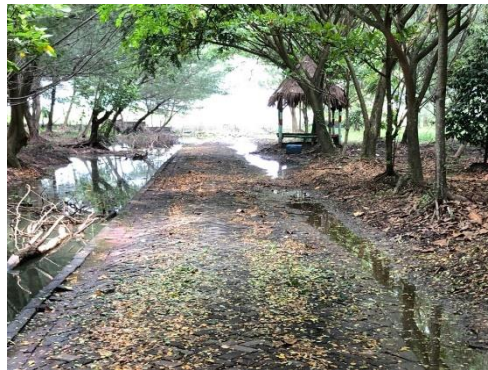
Gambar 4. 2 Genangan Pada Hutan Kota Pakal Sumber : Survei Primer

Akan tetapi ketika musim hujan tiba, terdapat beberapa titik yang tidak dapat dinikmati oleh pengunjung. Hal ini dikarenakan adanya genangan yang timbul karena hujan yang mengguyur kawasan Surabaya khususnya Hutan Kota Pakal.