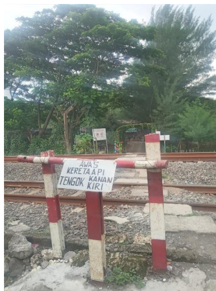
Gambar 4. 3 Rel Kereta Api

sehingga pada wilayah Hutan Kota Pakal terhindar dari suara kebisingan. Akan tetapi pada wilayah Hutan Kota Pakal ini tidak sepenuhnya terhindar dari kebisingan, karena terdapat rel kereta api yang berada tepat pada pintu masuk Hutan Kota Pakal yang menimbulkan suara yang mengganggu ketika ada kereta api yang melewati rel tersebut.