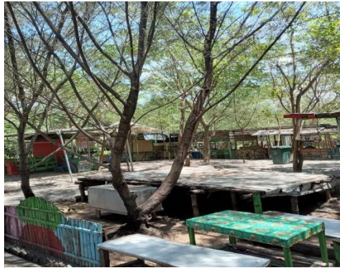
Gambar 4. 1 Kios Makanan dan Tempat Istirahat

Akan tetapi ketika musim hujan tiba, terdapat beberapa titik yang tidak dapat dinikmati oleh pengunjung. Hal ini dikarenakan adanya genangan yang timbul karena hujan yang mengguyur kawasan Surabaya khususnya Hutan Kota Pakal.