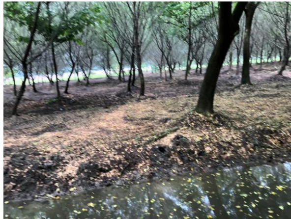
Gambar 4. 4 Pohon Pada Lokasi Hutan Kota Pakal

yang menunjukkan bahwa penataan pohon yang tertata secara teratur.