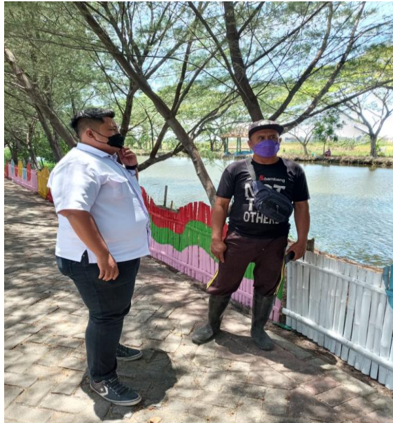
GAMBAR 4. 5 WAWANCARA DENGAN PENGURUS