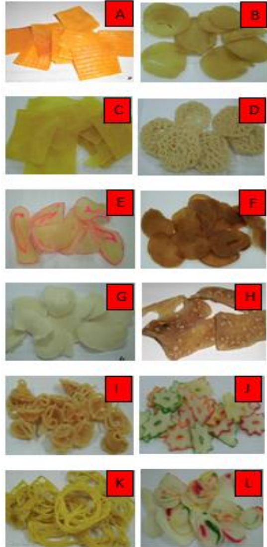
Gambar 1. Sampel Kerupuk

Berdasarkan survey diperoleh 12 jenis kerupuk yang beredar di Pasar Tradisional Semolowaru, Surabaya yaitu