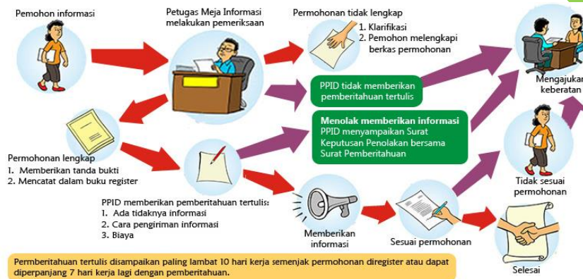
Gambar 2. Alur Pelayanan Permohonan Informasi

Standart Operasional Prosedural (SOP) dalam pelayanan juga sudah sangat bagus dan simpel. Seperti gambar di bawah ini: