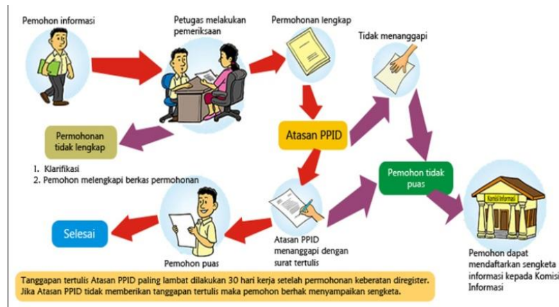
Gambar 3. Alur Pelayanan Permohonan Keberatan