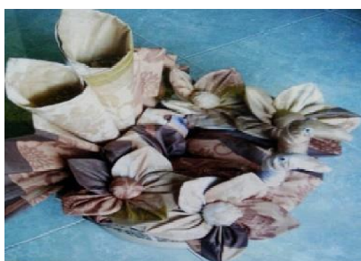
Terbuat dari spreii, sarung bantal dan sarung guling