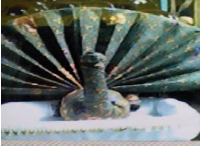
Terbuat dari Kain Jarik

Dalam Kegiatan ini telah diikuti oleh sekelompok Ibu-ibu anggota PKK Perumahan Permata Hijau, Candi Sidoarjo dalam pelaksanaan program adalah berperan aktif dalam setiap pelatihan yang diprogramkan dan dapat mengimplementasikan hasil pelatihan.