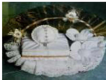
Terbuat dari Mukenah dan Sajadah