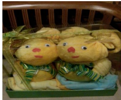
Terbuat dari Handuk